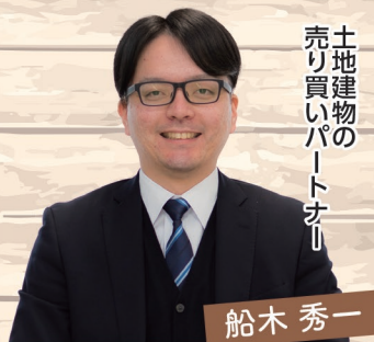
土地建物の 売り買いパートナー