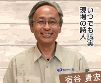
いつでも誠実 現場の詩人