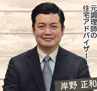
元調理師の 住宅アドバイザー