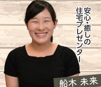
安心・癒しの 住宅プレゼンター