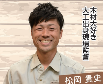
木材大好き 大工出身現場監督