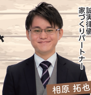
誠実律儀 家づくりパートナー