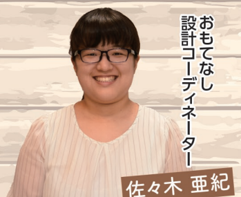
おもてなし 設計コーディネーター