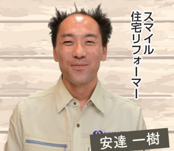
スマイル 住宅リフォーマー